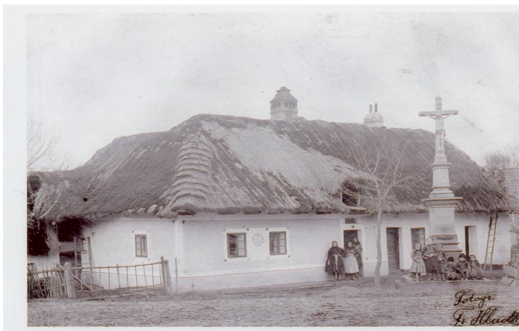
Fotografie první školy v Prakšicích (tzv. u kříže). Byla postavená v roce 1779 jako jednotřídka. Foto je z konce 19. století. Stála západně od mostu u obchodu Jednoty