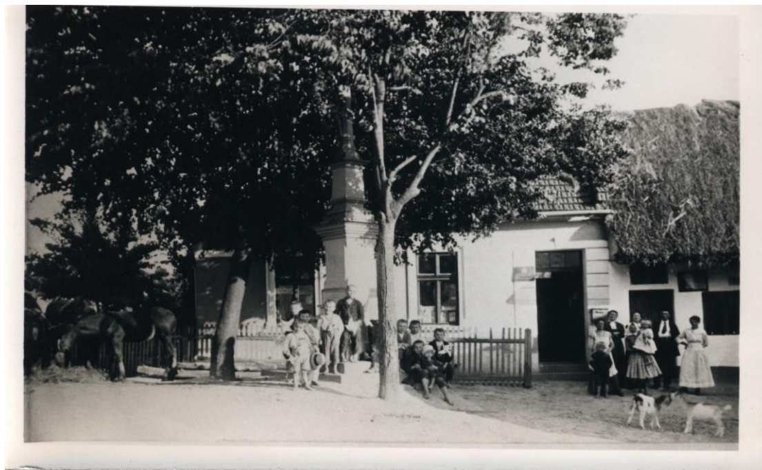
Levou část školy – třídu pro vyučování – přestavěl po 1. světové válce p. Alois Buráň (původem z č. 27) na obchod