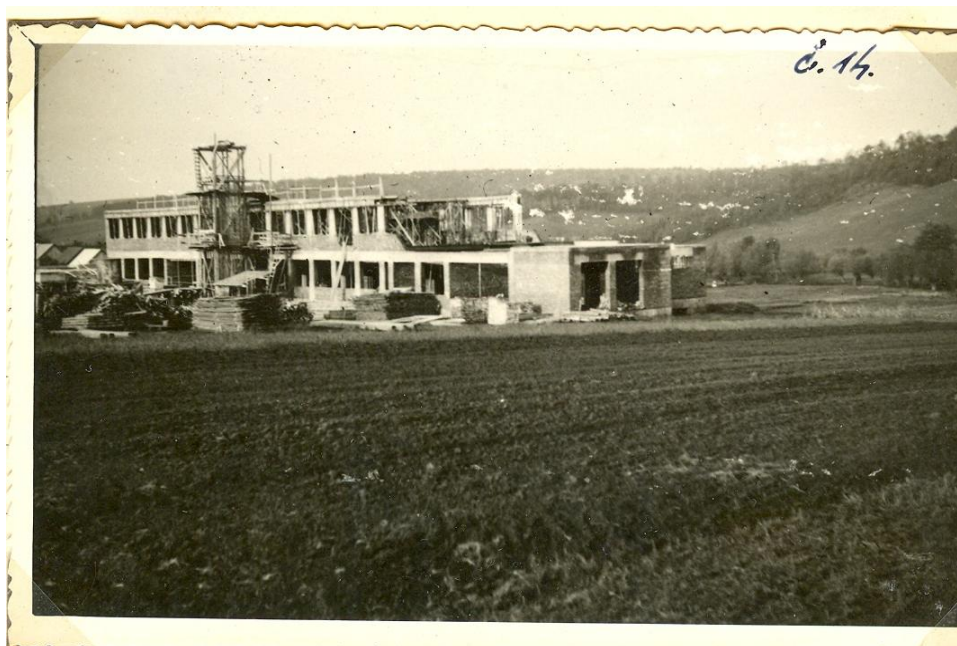
Pohled na vyzděnou hlavní budovu s částí 1. poschodí nad obecnou školou