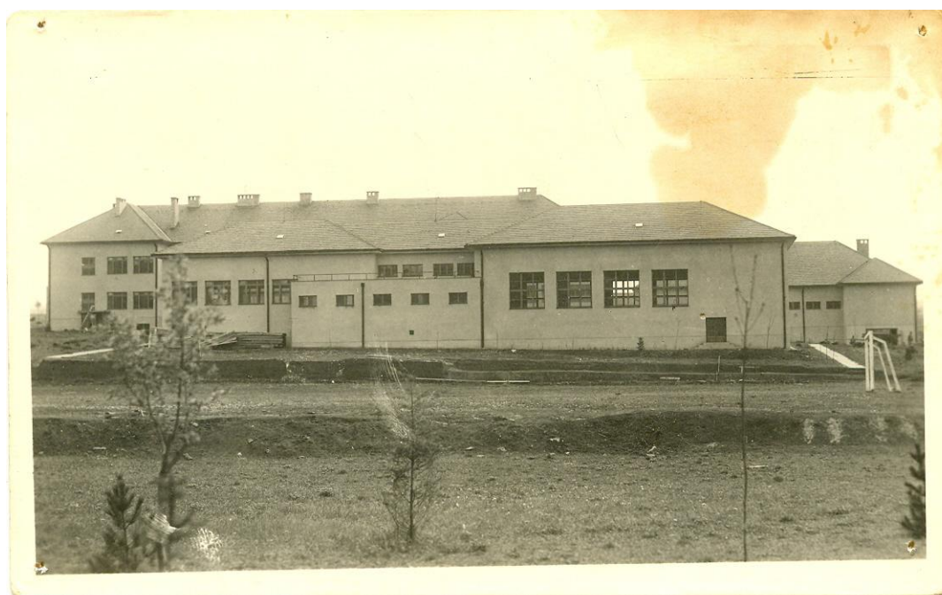
Pohled na školní budovu z Greftů a budování hřiště