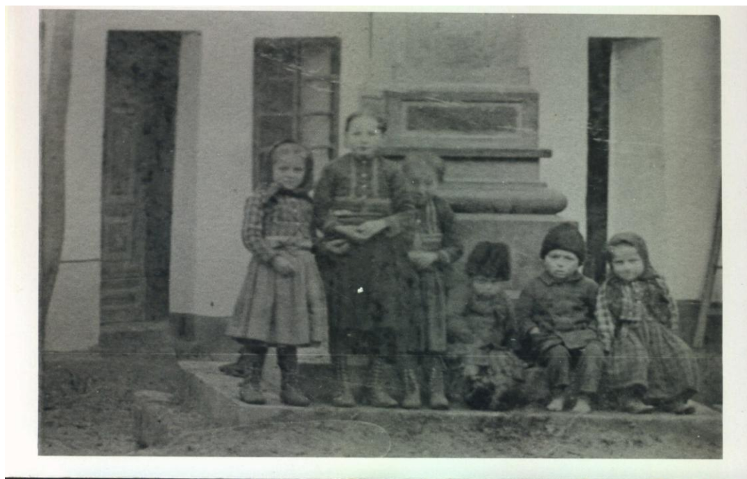
Skupina dětí před křížem u první prakšické školy – foto z počátku 19. století