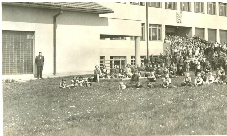
První školní rok 1950/51